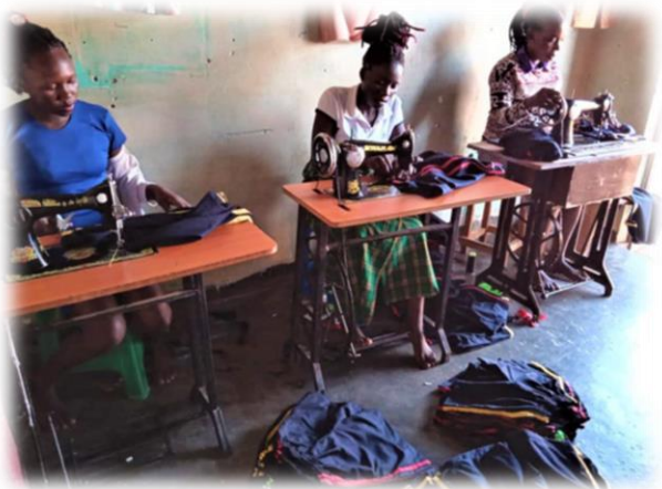
Tailors sewing the uniforms

Die Angehörigen wurden zur Übergabe der Uniformen eingeladen und über unsere Spende informiert.