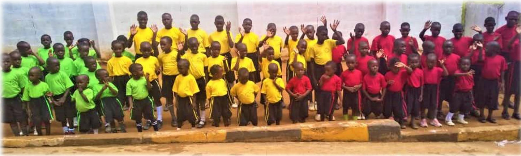
Children in the newly acquires sports wear and school uniforms. All are sooooo happy 😊