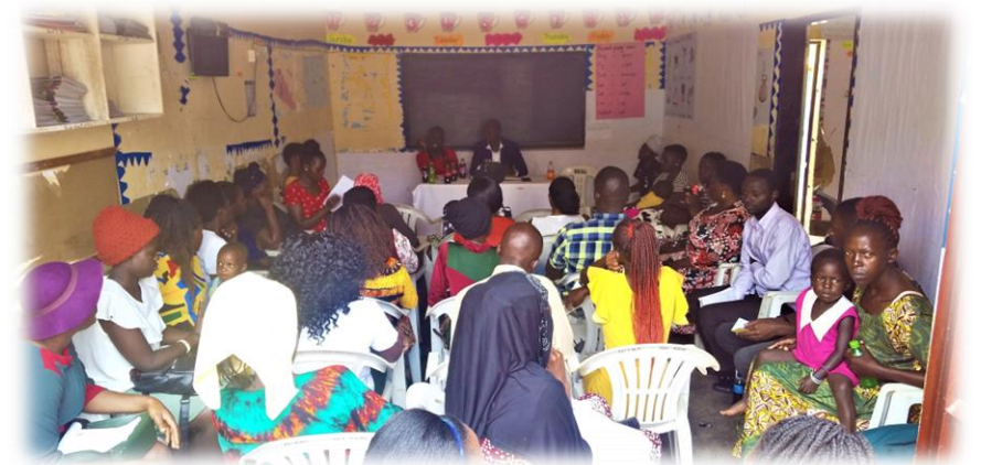
meeting with families